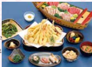
↑Chartered Cruise: 5Person Set

For shared cruising Reservations must be made in groups of 2 people or more.