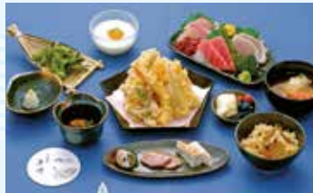
↑乗合船用(天ぷら・お刺身1人盛り)