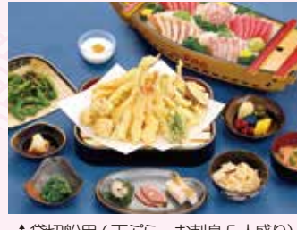
↑貸切船用(天ぷら・お刺身5人盛り)